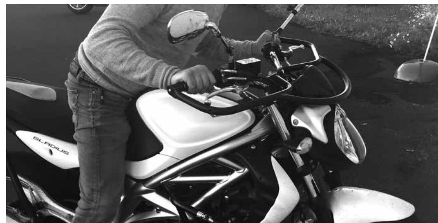
Billede 3: Skub