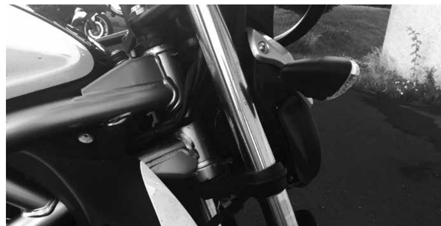
Billede 2: Hvor?

Kontrol (billede 2 & 3): Skub MC'ens forhjul op mod en fast genstand fx en mur. Slør mærkes som et klik i gafflen når man trækker den ind mod muren. Er der ikke en fast genstand kan du stå med front mod MC'en med forhjulet mellem benene og rykke hårdt fremad i styret ind mod dig selv. Der må ikke mærkes slør.