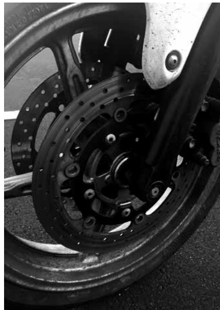
Billede 15: Huller i skiven