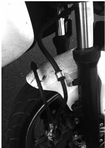
Billede 14: Følg slangen

Kontrol (billede 14): Følg slangen ned til hjulet, se efter utætheder ved banjoboltene der skrues slangen fast til hovedcylinderen og kaliberen ved hjulet. Se efter revner, hvis slangen har været i klemme. Den skal sidde i de bøjler der forhindrer den klemmes.